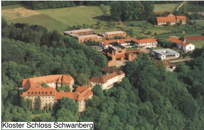
Kloster Schloss Schwanberg

Zweimal im Jahr treffen wir Oblatinnen uns zu geistlichen Tagungen auf dem Schwanberg. In der wechselseitigen Fürbitte wissen wir uns aufgehoben. Sie ist ein wesentliches geistliches Band - so-