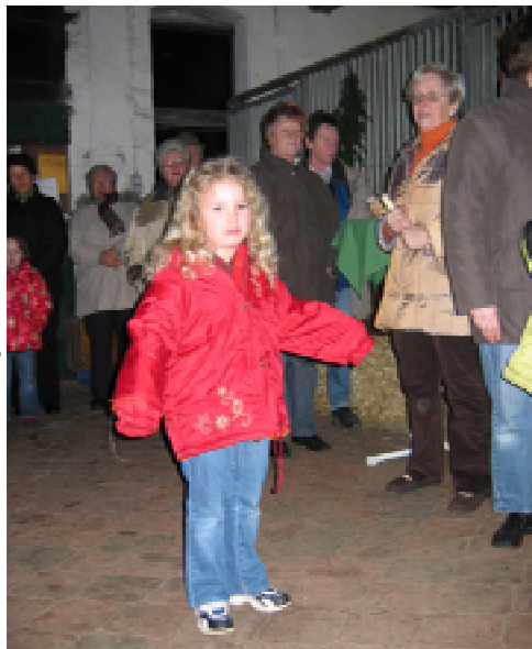
Advent auf dem Hof von Erasmis

Auch 2004 gehörte der Lebendige Adventskalender zum Schwaneweder Leben. Es gab wie im Vorjahr jeden Abend eine Über-raschung, wenn die „Tür“ geöffnet wurde: gemeinsam gesungene Lieder, Gedichte, amüsante und nachdenkliche Geschichten, Selbstgebackenes und handgemachte kleine Geschenke, kurze Theaterstücke, Musik mit leisen Flöten und lauten Posaunen, Engel, ein Pony mit einem Sack voller Nikolausgaben, Kerzenschein, gemeinsame Gebete und Segenswünsche – ein stimmungsvoller Dezember an 23 verschiedenen Orten in unserer Gemeinde.